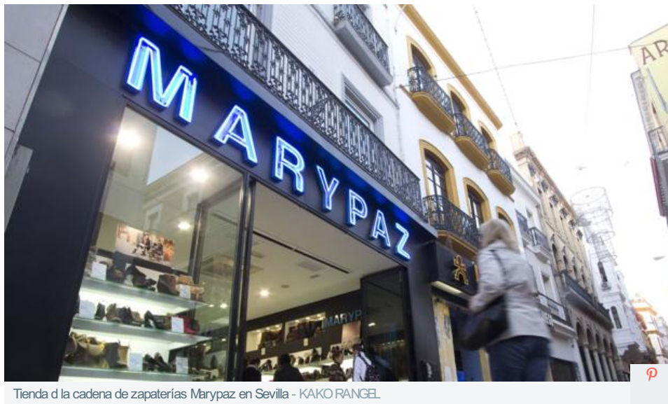
Tienda d la cadena de zapaterías Marypaz en Sevilla